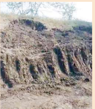
करणाऱ्यावर नेवासा तहसीलदार काय अंक्शन घेतात, याकडे तालुक्याचे लक्ष लागले आहे